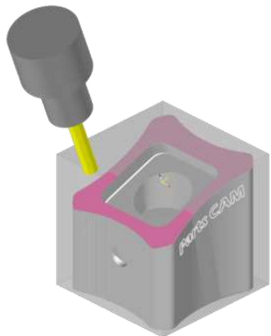
位置決めシミュレーション