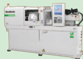
V-LINE® 小物精密部品専用 高応答射出成形機