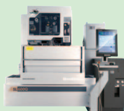
リニアモータ駆動 高速ワイヤ放電加工機