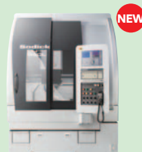
リニアモータ駆動 ウルトラハイスピードミールングセンタ