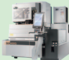
リニアモータ駆動 高速・高性能 ワイヤ放電加工機