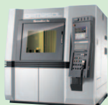
金属3Dプリンタ リニアモータ駆動 ワンプロセスミールングセンタ