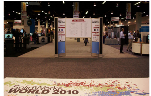
SolidWorks World 2010

会期：1月23日（日）～26日（水） 会場：The Henry B. Gonzalez Convention Center 200 E. Market St. San Antonio, Texas, 78205 USA 詳細： http://www.solidworks.com/swworld2011/